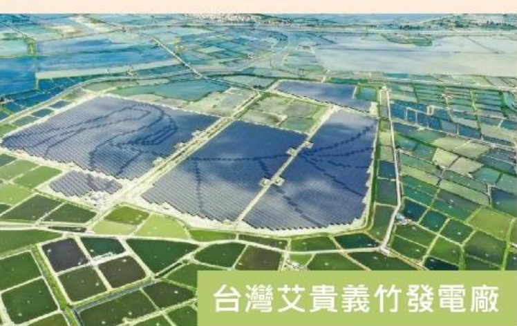
台灣艾貴義竹發電廠